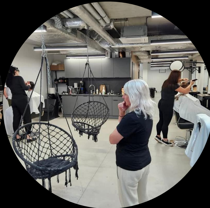
Technologický postup pri úprave vlasov a brady