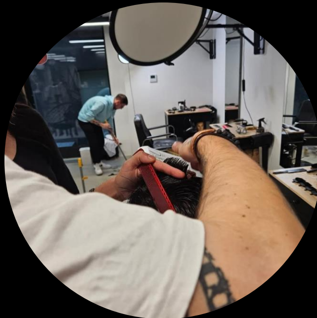
Starostlivosť o vlasy