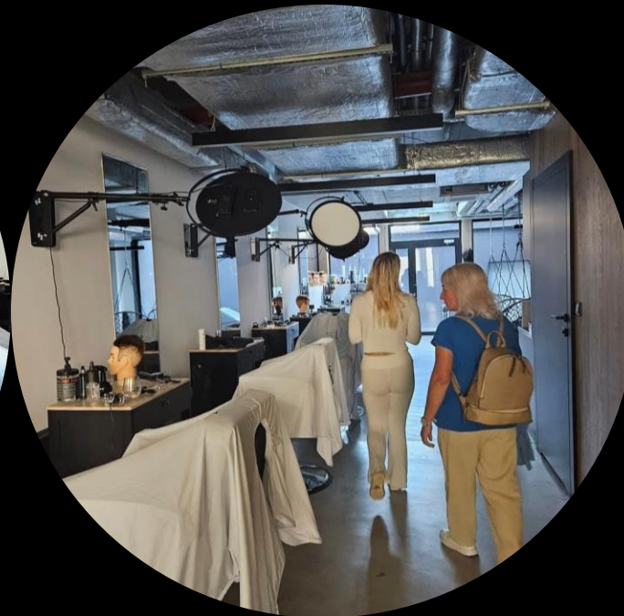
BOZP v praxi