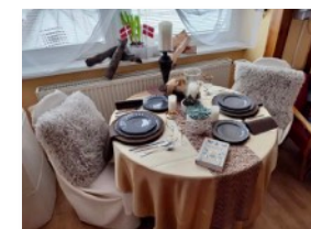
ukážka stolovania v štýle HYGGE v školskej jedálni