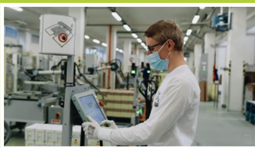
duálny systém vzdelávania vo firme Nestlé