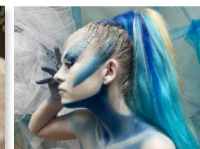
súťažná práca žiačky odboru kaderník - vizážista