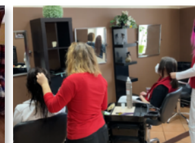
žiačky odboru kaderník na odbornom výcviku