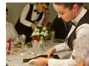
servis vína pri slávnostnom bankete