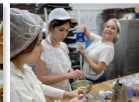
odborný výcvik v cukrárskej výrobni